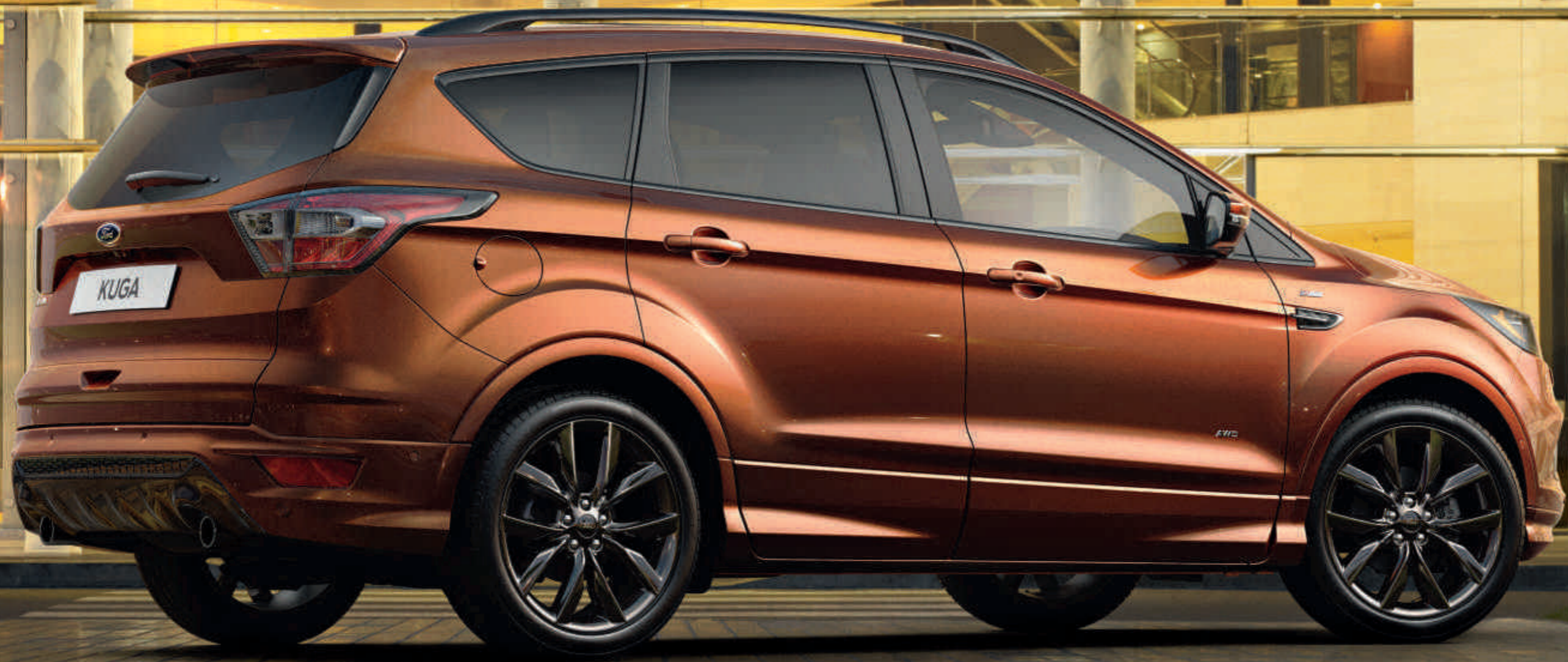
Prikazani model je Kuga ST-Line sa opcionalnim 19-inčnim točkovima, velikim zadnjim spojlerom i metalik bojom karoserije Copper Pulse.