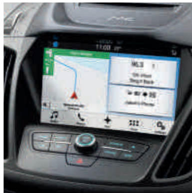
● Ford SYNC 3 sa kontrolom glasa i ekranom osetljivim na dodir veličine 8 inča.