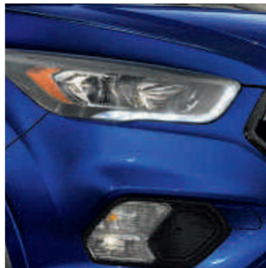
● Crni okvir prednjih svetala.