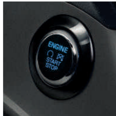
● Pokretanje bez ključa.