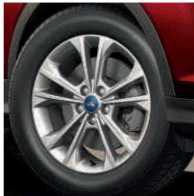
● 17-inčni točkovi od lake legure.