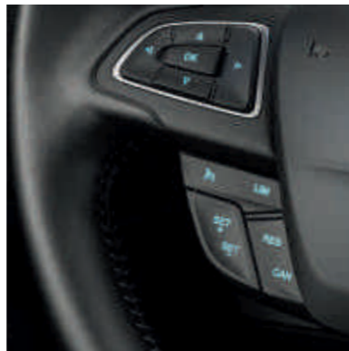
● Tempomat sa podesivim ograničavačem brzine.