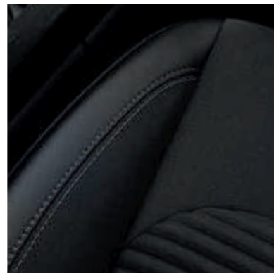
● Delimično kožna sedišta.