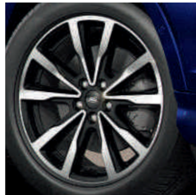
● 18-inčni točkovi od lake legure.