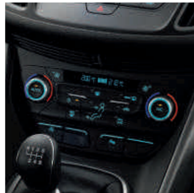
● Dvozonnska automatska elektronska kontrola temperature (DEATC).