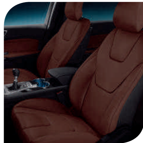
Salerno koža u boji Tobacco*