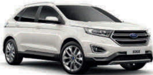
White Platinum Troslojna metalik* (T) (S)