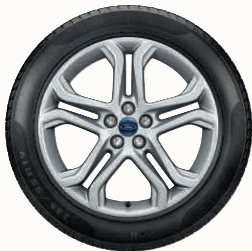
19" 5x2-kraki točkovi od legure (opremljeni pneumaticima 235/55)