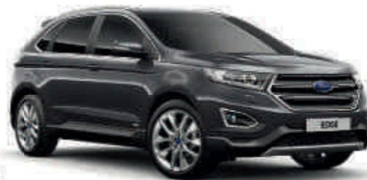
Magnetic Metalik* (T)