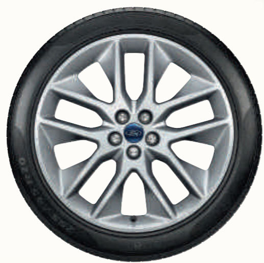
20" 5x2-kraki točkovi od legure (opremljeni pneumaticima 255/45)