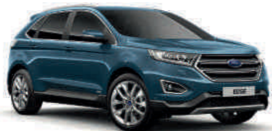
Nautilus Blue † Metalik* (T) (S)