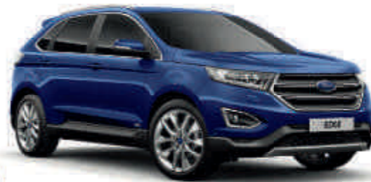
Kona Blue † Metalik* (T)