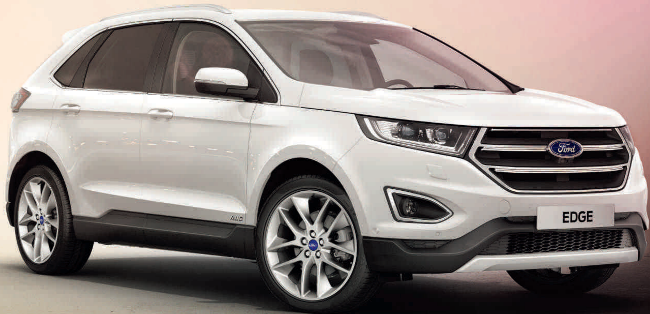
Edge Titanium u boji White Platinum sa 20-inčnim 5x2-krakim aluminijumskim točkovima (opcija) i pneumaticima 255/45.