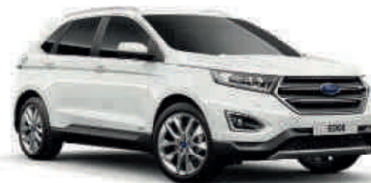
Oxford White Standardna (T) (S)

(T) (S) Titanium (S) (S) Sport Standardna oprema Opcija