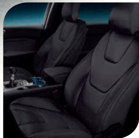
Salerno koža u boji Ebony*

Izgled i osećaj unutrašnjih materijala igraju veliku ulogu u ukupnom doživljaju vožnje. Zbog toga smo veliku pažnju posvetili dizajnu i izradi presvlaka za novi Ford Edge.