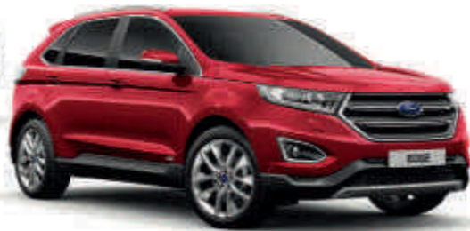
Ruby Red Troslojna metalik* (T) (S)