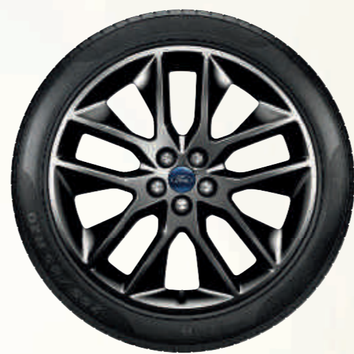
20" 5x2-kraki točkovi od legure (opremljeni pneumaticima 255/45)