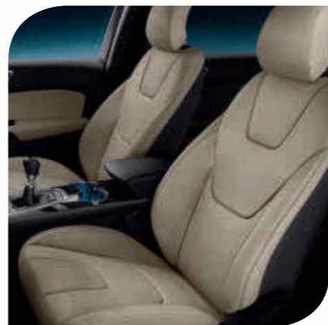
Salerno koža u boji Soft Ceramic*