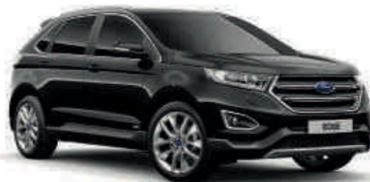
Shadow Black Mica* (T) (S)