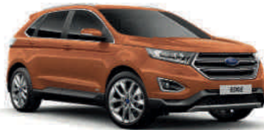
Canyon Ridge ° Metalik* (T) (S)