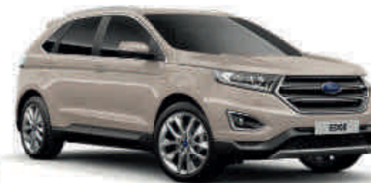
White Gold ° Metalik* (T) (S)