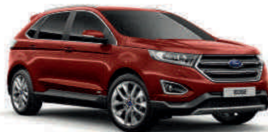
Bronze Fire † Metalik* (T) (S)