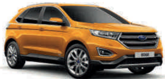
Electric Spice † Metalik* (T) (S)