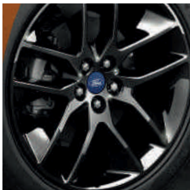
20-inčni točkovi od lake legure