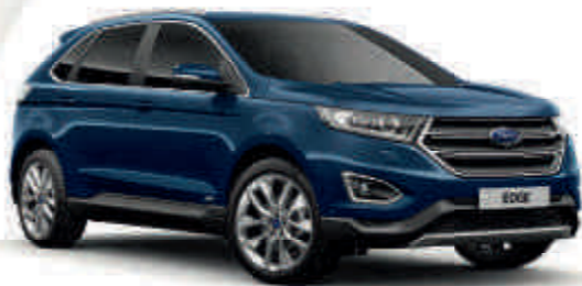
Blue Jeans ° Metalik* (T) (S)