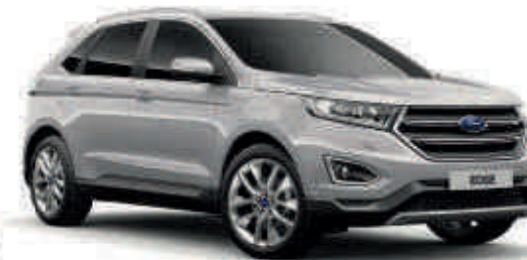
Ingot Silver Metalik* (T) (S)