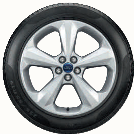
19" 5-inčni točkovi od lake legure (opremljeni pneumaticima 235/55)