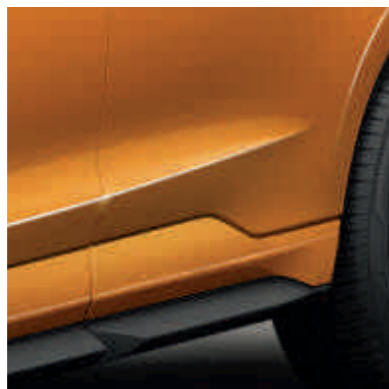
Spoljašnjost sportskog stila